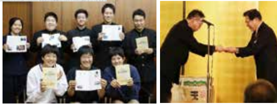
北橋市長へ目録贈呈