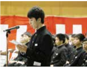
生徒会長による誓いの言葉