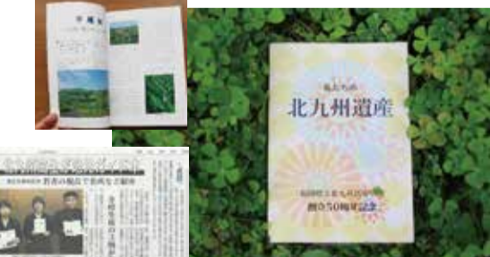
新聞社からの取材