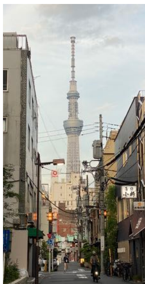
写真部門の会場は浅草。スカイツリーが壮観。