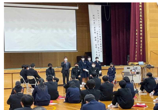
「パネリストの生徒も鋭い提案をして頑張りました。」