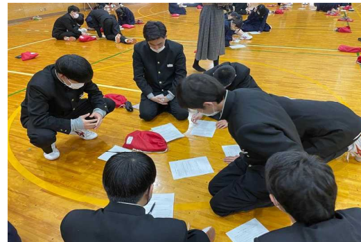
グループ討議も真剣です。