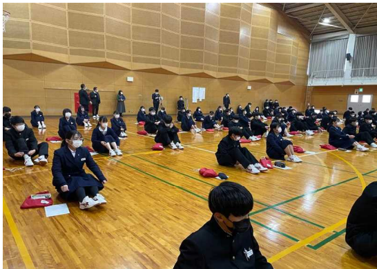
講演内容に興味津々です。